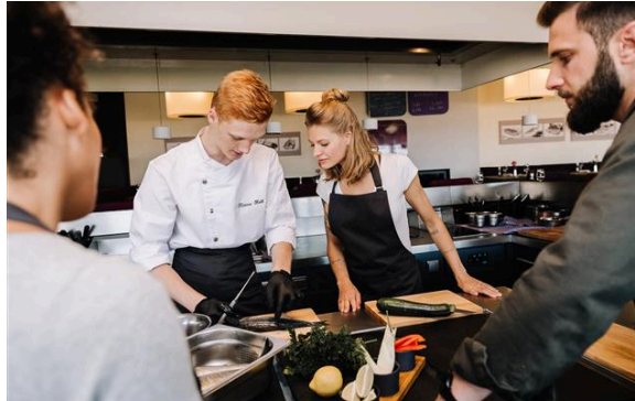
Kochschule im höchsten Panoramarestaurant "DONNER'S Wein- & Küchenbar" von Cuxhaven

Hier geht's zu den Incentive-Angeboten >>>