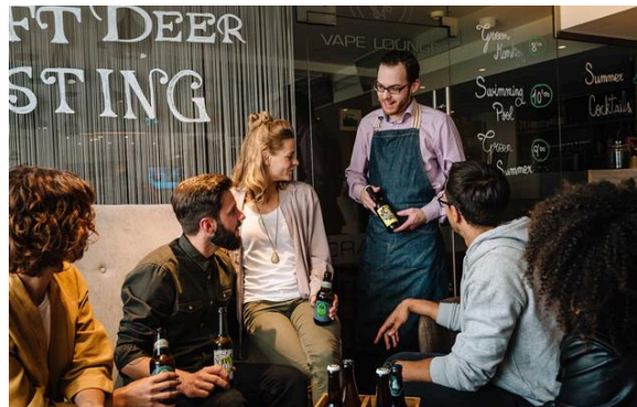
Craft-Beer-Tasting in der Hotelbar "CraftClub"